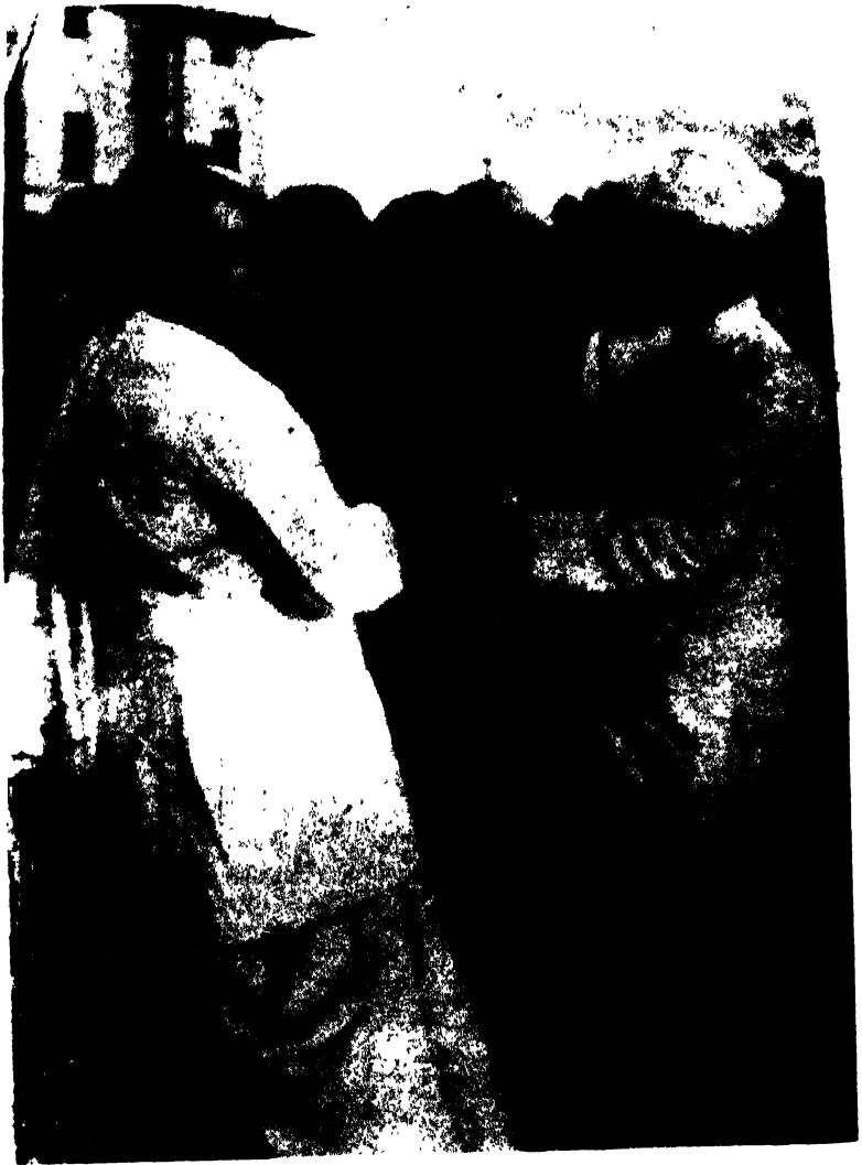
ড° সৰ্বগম্ভীৰী বাখাৰুৰ সৈতে গুৱাহাটীত