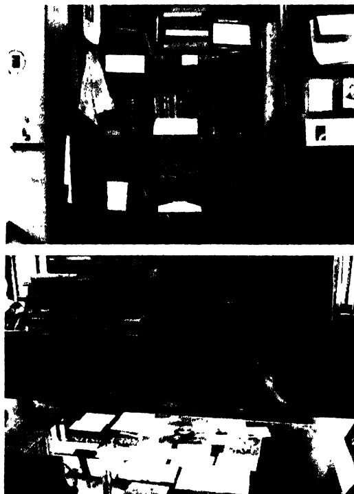
ড" সূৰ্য্যকুমাৰ ভূঞাৰ পঢ়া কোঠাৰ ভিতৰভাগ