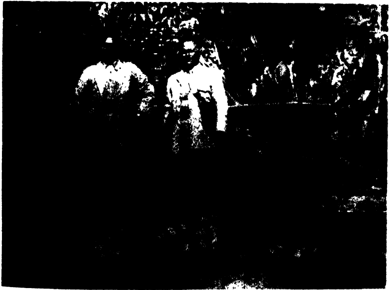
চিকারী ড° ফুণা