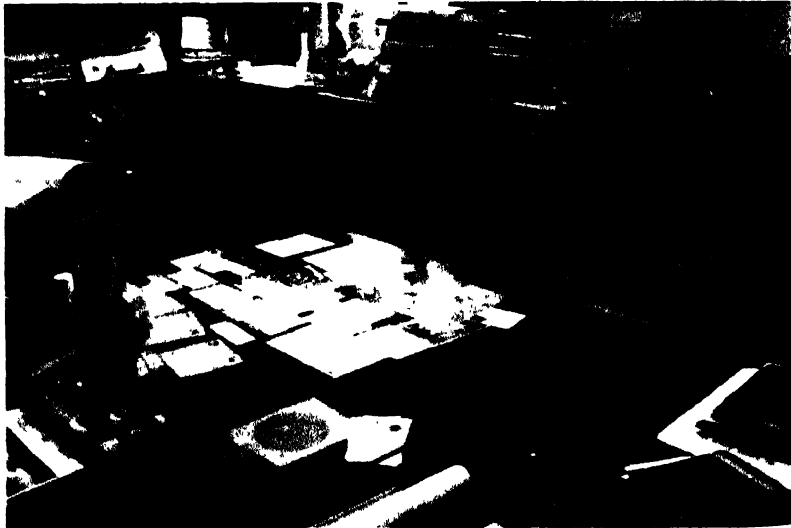
২২০ ♦ সূৰ্য্যকুমাৰ ভূঞা