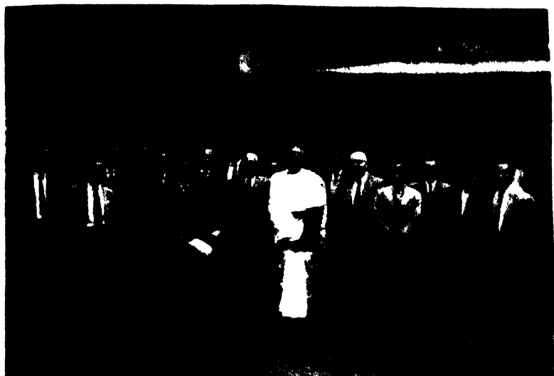
নৰ্থ-ইষ্ট হিল ইউনিভাৰ্ছিটীৰ সদস্যসকলৰ সৈতে ড° ডুঞা