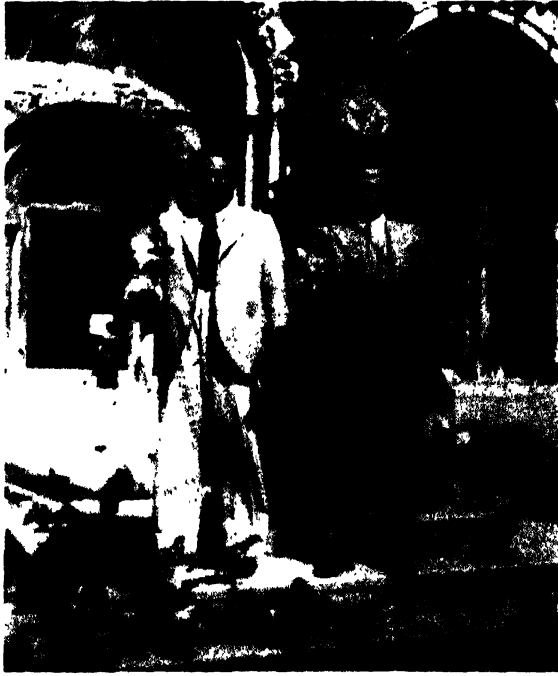
লণ্ডনত ড° ভূঞা