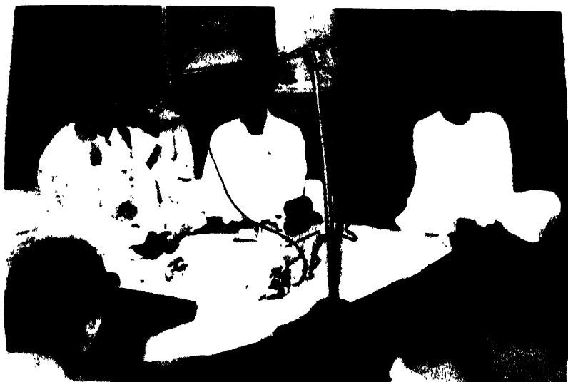
দুয়োখন ছবিত বক্তাবত অৰক্ষাত ড° জুঞা